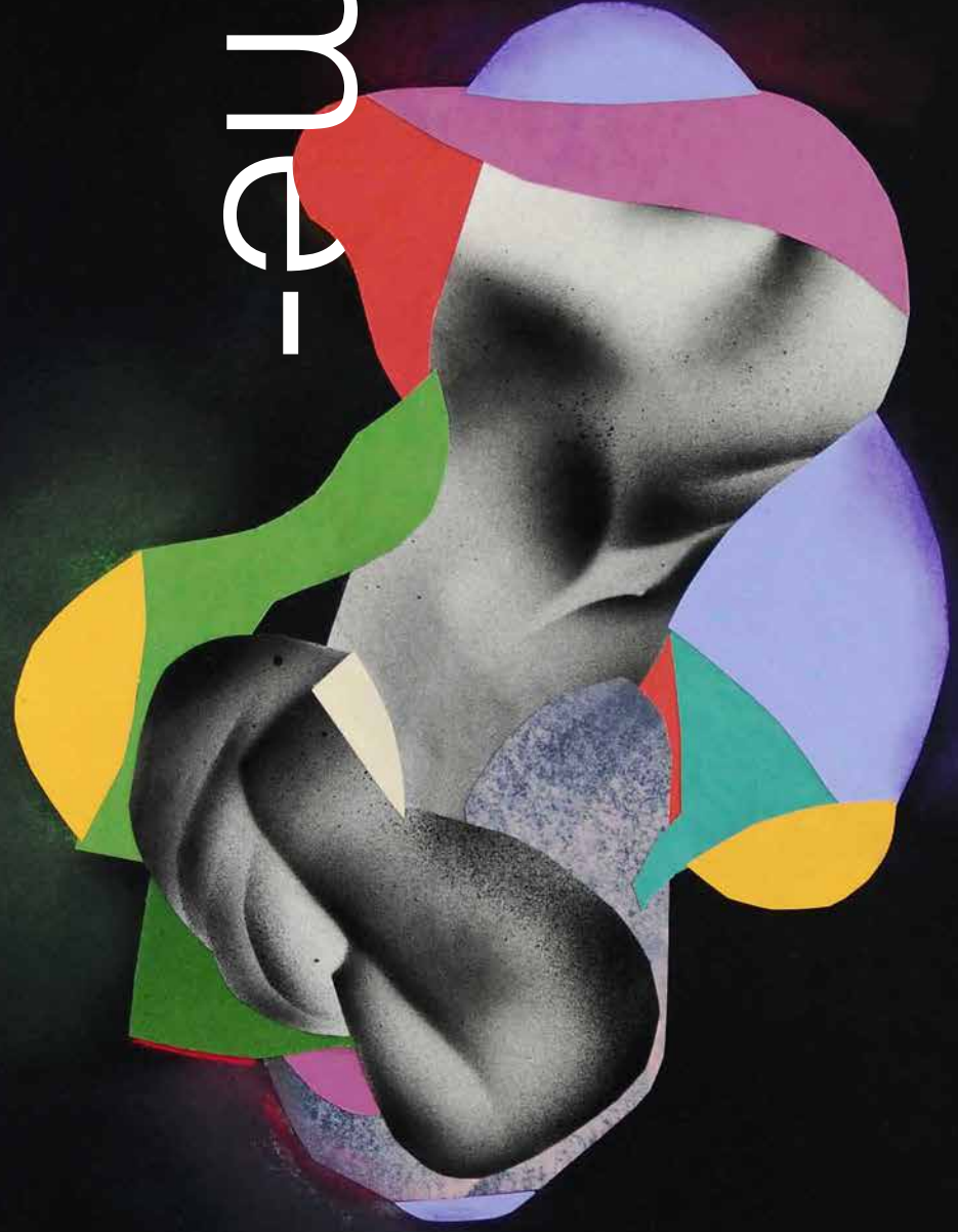
Serie Mimesis 1, 2, 3, 4, y 5. Políptico. 50 x 50. c. u. Aerosol, pastel y collage sobre papel. 2019.