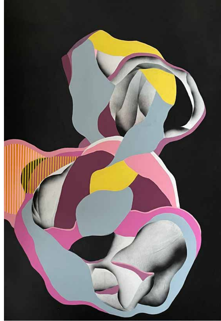
Serie Universos Cíclicos IV 180 x 120. Acrílico y aerosol sobre lienzo. 2022