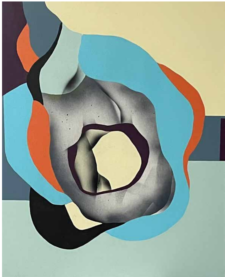
Serie Nidos-Nudos XI. Díptico, 100x 81 c. u. Acrílico, esmalte y aerosol sobre lienzo. 2019