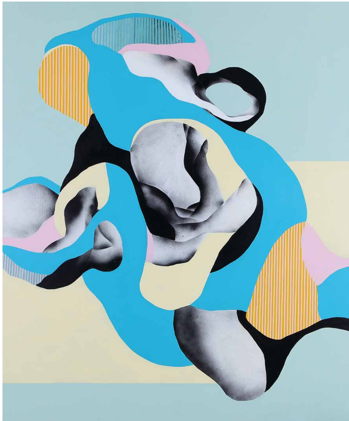
Serie Nidos-Nudos I 195 x160. Acrílico, esmalte y aerosol sobre lienzo. 2019