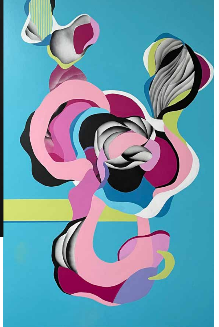
Serie Universos Cíclicos II. 180 x 120. Acrílico y aerosol sobre lienzo. 2022